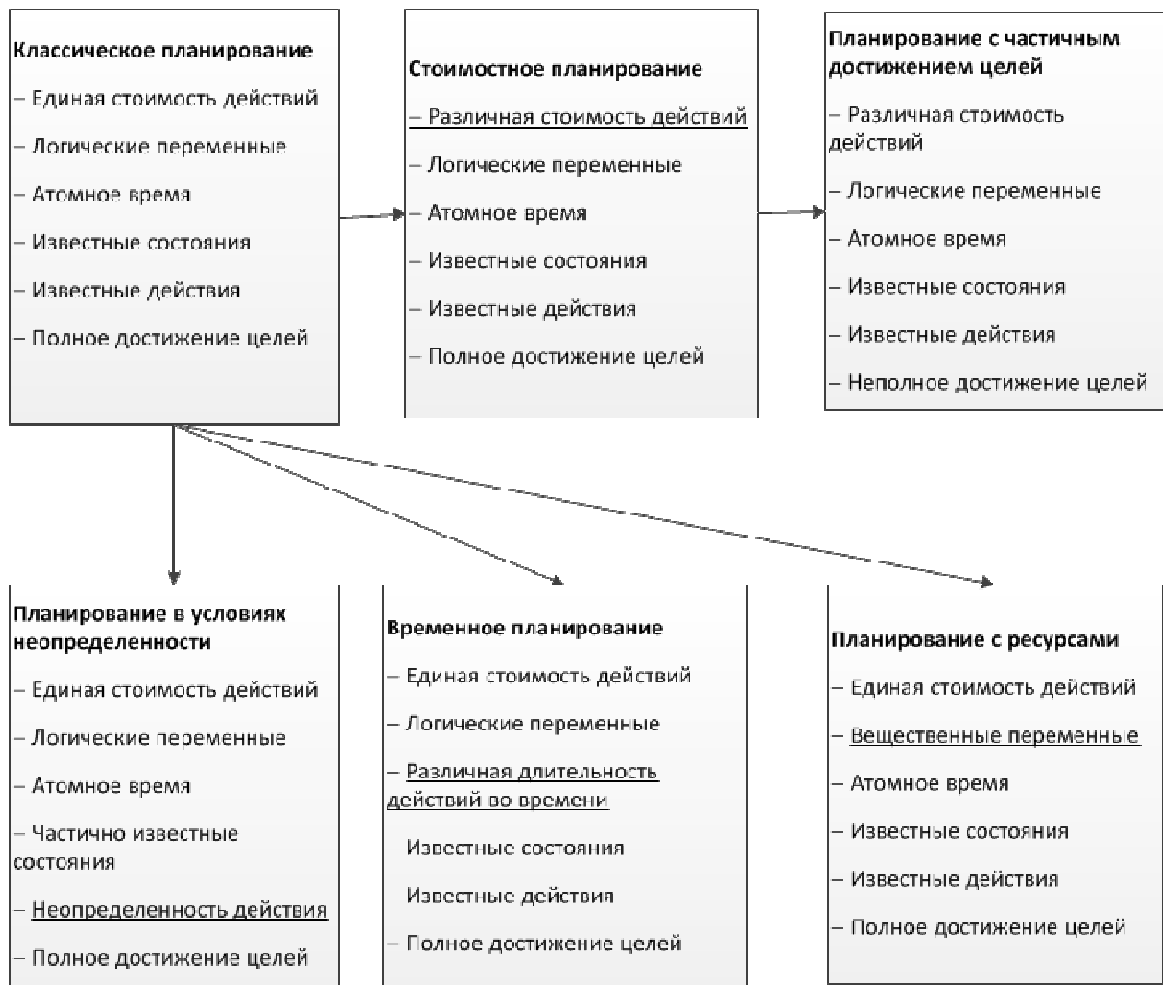
Рис. 1. Различные виды задач планирования